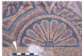
1. Söğütlü, 2. Kurtaran