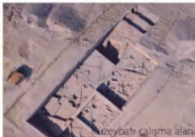
Zeytinli çalışma alanı