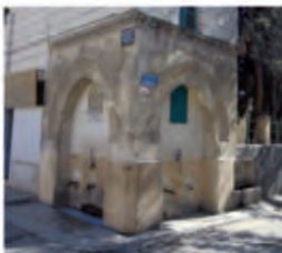
Küçük Çarşı Kasteli