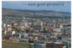
Kent genel görünümü