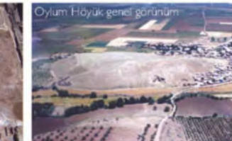
Oylum Höyük genel görünüm

In the city of Kilis, which has been home to many different settlements, excavations were carried out in 2010 in the ruins of Kurukastel; the ruins of Söğütlü; the village of Kurtaran; and the Çörten Tumulus, in addition to those in the Oylum Tumulus. During the course of these excavations, mosaics dating back to 4 th -5 th centuries AD were unearthed.