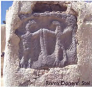
Roma Dönemi Stel