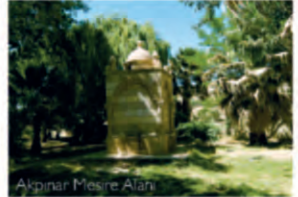
Akpınar Mesire Alanı