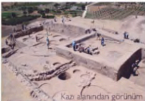
Kazı alanından görünüm

Yerleşimin çok yoğun olduğu Kilis'te 2010 yılında Oylum Höyük dışında Kurukastel Ören Yeri, Söğütlü Harabeleri, Kurtaran Köyü ve Çörtten Höyüğü'nde kazılar yapılmıştır. Kazılarda M.S. 4-5. yüzyıla ait mozaiklere ulaşılmıştır.