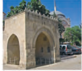
İbşir Paşa Kasteli