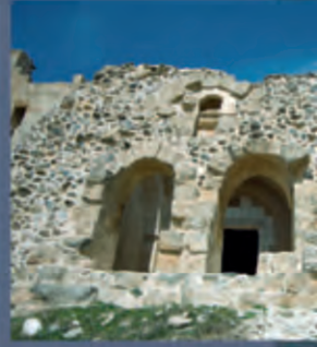
Ravanda Kalesi'nden görüntüler

The Ravanda Castle lies to the northwest of Kilis, next to Belenözü village, to the east of Afrin Brook and at 28 km distance from the city centre.