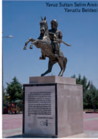
Yavuz Sultan Selim Anıtı Yavuzlu Beldesi