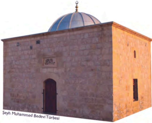
Şeyh Muhammed Bedevi Türbesi

built by the famous Mimar Sinan. The similarity of the structure to Hüsreviye Mosque in Aleppo strengthens that belief.