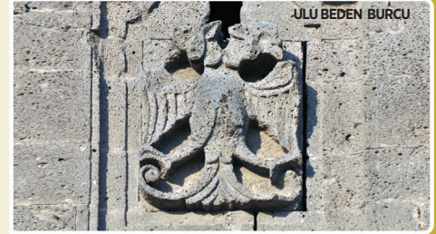
ULU BEDEN BURCU