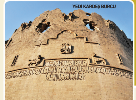
YEDİ KARDEŞ BURCU