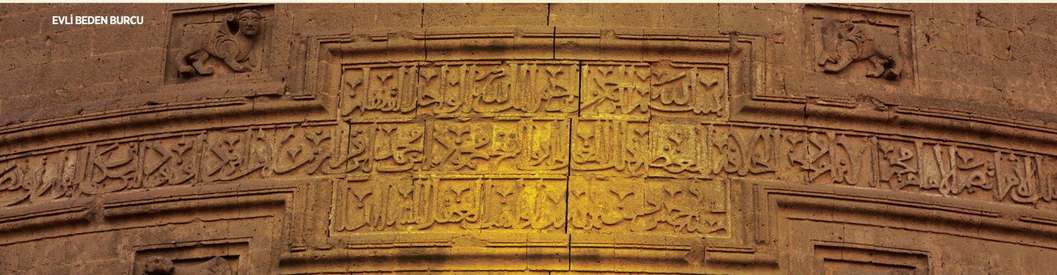
EVLİ BEDEN BURCU