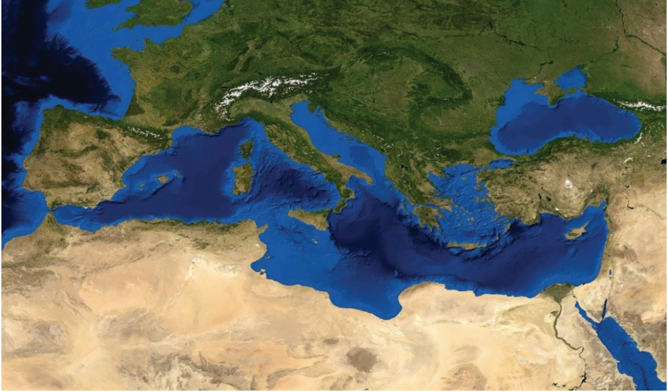
Şekil 1: Akdeniz havzası, Adriyatik ve Ege Denizi

Yunanistan, Adriyatik, Ege ve Akdeniz'in üç tarafını çevrelediği yarımada, büyük bir körfez ülkesi konumundadır. Bulunduğu konum itibarıyla Avrupa'yı Asya ve Girit Adası ile Afrika'ya bağlayan deniz yolu güzergâhı üzerinde bulunması, tarih içinde ticari, ekonomik ve kültürel ilişkilerin gelişmesinde önemli bir etken olmuştur.