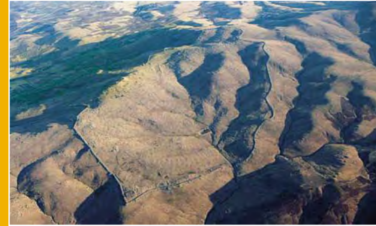
Resim 1 – Kerkenes Harabelerindeki Sur Duvarlarının Hava Fotoğrafi İle Görüntüsü

Yozgat'ın Sorgun ilçesi Şahmuratlı köyünde bulunan Kerkenes dağı antik kentinde ilk yüzey araştırması çalışmaları 1993 yılında başlamıştır. 1998-2000 yıllarında müze ile katılımlı araştırma şekline dönüşmüş ve 2001 yılından bugüne kadar da İngiliz uyruklu Dr.Geoffrey Summers başkanlığında kazı ve