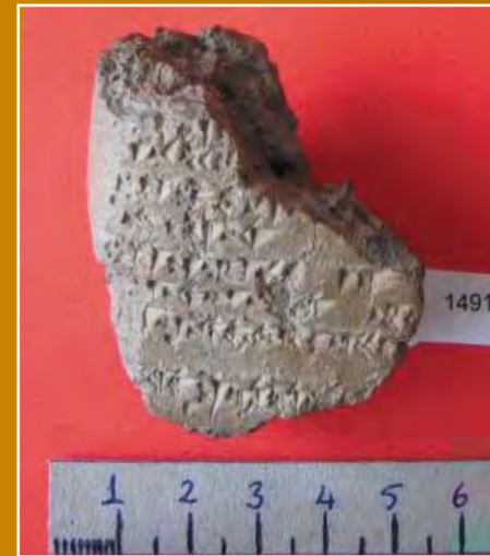
Resim 2 Galatia Bölgesinden Asur Ticaret Kolonileri Çağma Ait Pişmiş Toprak Tablet Picture 2. A sandstone tablet of Assyrian commercial colony age from Galatian area

Bu çalışmalar kapsamında, Büyüknefes ve çevresinde yer alan birçok köyde de yüzey araştırmaları yapılmış (Yakuplu, Süleymanlı, Körpeli, Haydarbeyli, Sağlık, Dereboymul, Beşerek, Susuz, Çamdibi, Çakırhacılı, Zincir, Türkmensarılar, Yassihöyük, Çatma, Sarıfatma, Cihanpaşa, Salmanlı v.s.) geniş bir çevrede tarihin izleri tespit edilmiştir. Araştırmalar sonunda çok sayıda seramik parçaları, sütun kaide ve tamburları, mezar stelleri, Bizans dönemine ait yazıtlı mezar, bir çok mimari parçalarına rastlanılmıştır. Geniş bir çevrede yapılan çalışmalar sonucunda şu ana kadar, Kalkolitik çağdan – İslami döneme kadar iskan izlerine rastlanılmıştır.