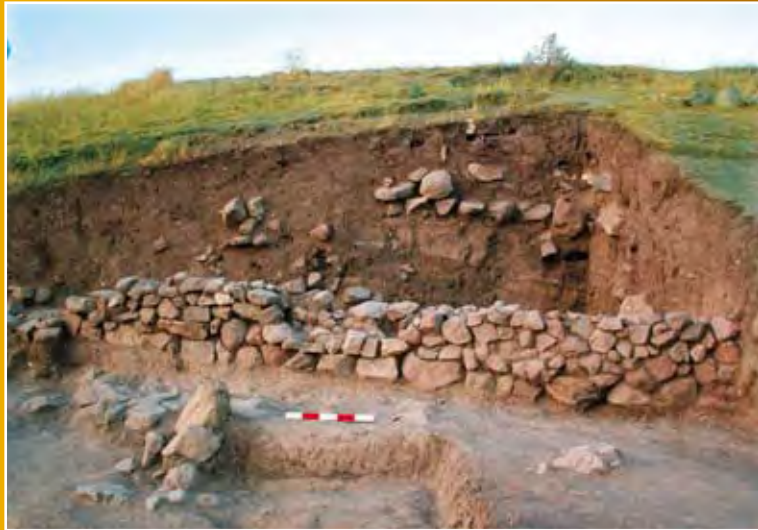
Resim 1 - Çadırhöyük'te Kazı Çalışması Neticesinden Bir Görünüm

Çadırhöyük'te yapılan kazılar neticesinde çok sayıda çeşitli dönemlere ait eserler bulunmuştur. Höyükte Kalkolitik, İlk Tunç, Erken Hitit, Hitit İmparatorluk, Frig, Hellenistik, Roma ve Bizans dönemlerine ait tabakalar tespit edilmiştir.