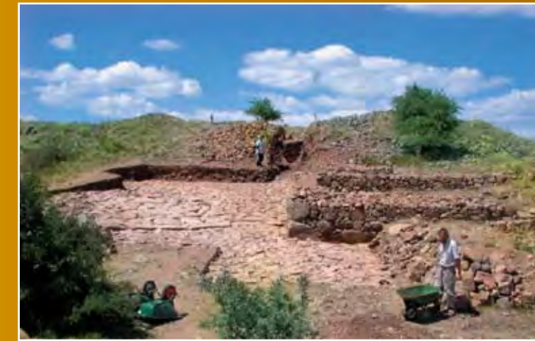
Resim 2 – Kerkenes Kazı Alanından Bir Görüntü

Tahminler ve elde edilen bazı verilere göre M.Ö.3-2. Yüzyıllara ait bazı Galat mezarları da Bizans döneminde soyulmuş ve değerli parçalar yağma edilmiştir. Kentin önemli özelliklerinden biri de çabuk bozulabilen kumtaşı denilen bir çeşit taşın mimari, heykeltıraş ve yazıtlarda çok sık kullanılmış olmasıdır.