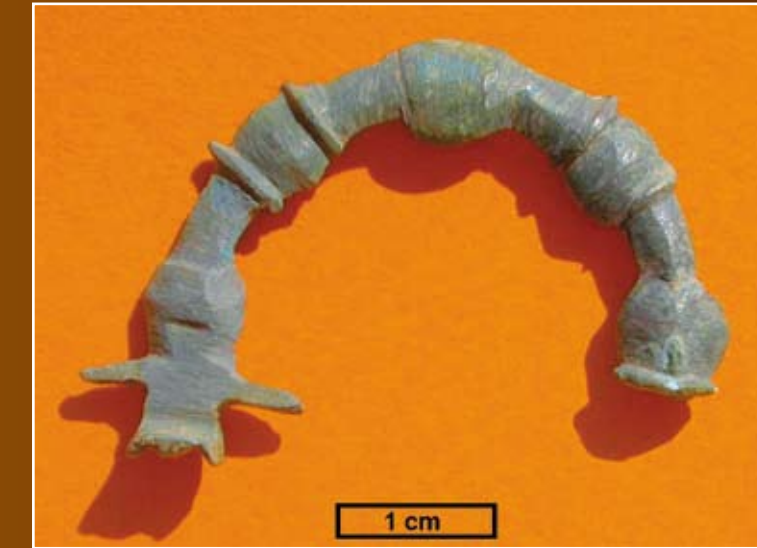
Resim-4 Kerkenesten Madeni Fibula

According to the thoughts and some colleted datas some tombs related to 3-2 B.C. were robbed and valuable things were phundered. One of the most important feature of the city is that a kind of stone corrupts easily called sandstone was used in architecture, monuments and inscriptions.