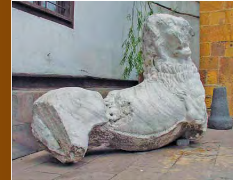
Resim 4 – Tavium' dan Galat Aslanı Picture 4. A Galatian lion from Tavium

Through this studies, in Büyük Nefes and nearby villages (Yakuplu, Süleymanlı, Körpeli, Haydarbeyli, Sağlık, Dereboymul, Beşerek, Susuz, Çamdibi, Çakırhacılı, Zincir, Türkmensarılar, Yassihöyük, Çatma, Sarıfatma, Cihanpaşa, Salmanlı, e.t.c.) surface studies have been done and in a large area traces of history have been found. As a result of research studies ceramic pieces, column base and tomb stells, a tomb with an inscription belonging to Byzantium era, and a lot of architectural remains have been found. Up to now, through the large area research studies remains of settlement from Chalcolitic age to Islamic era have been encountered.