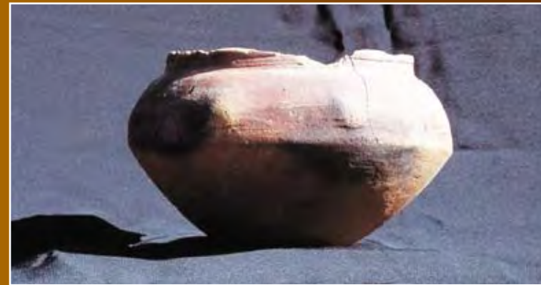
Resim 2 – Çadırhöyük Kazısından Pişmiş Toprak Çanak

Through the excavation studies ,in Çadırhöyük, a lot of historical works of art were found.In Tumuli ;Catholic, first bronze , early Hittite , Hittite era , Phrygian , Hellenistic , Roman and Byzantium era stratums were found.