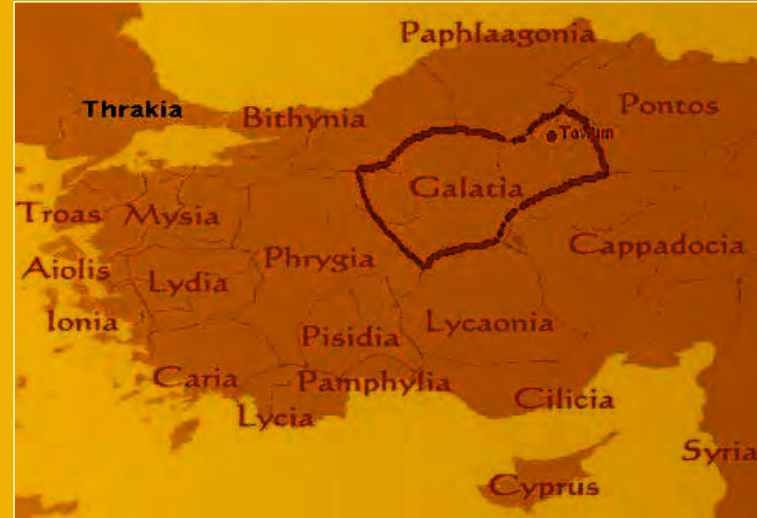
Resim 1- Galatia Bölgesi ve Tavium Picture 1. Galatian area and Tavium

Tavium Antik Kenti Yozgat il merkezinin 40 km. batısında bulunan Büyük Nefes Köyü'nde yer almaktadır. Tavium'da Hitit ve Frig yerleşim izleri görülmesine rağmen asıl yerleşim Galatlar zamanında M.Ö. 3.yy ile 1.yy arasında olmuştur. Tavium; Romalıların Galat dedikleri kavmin M.Ö.280'li yıllarda Balkanlardan Anadolu'ya gelen Trokme (Trokmi) kolu tarafından kurulmuştur. Kent İç Anadolu Bölgesinde Trokmilerin yaşadığı Orta Kızılırmak Yöresinin ticaret merkezi ve başkenti konumundaydı.