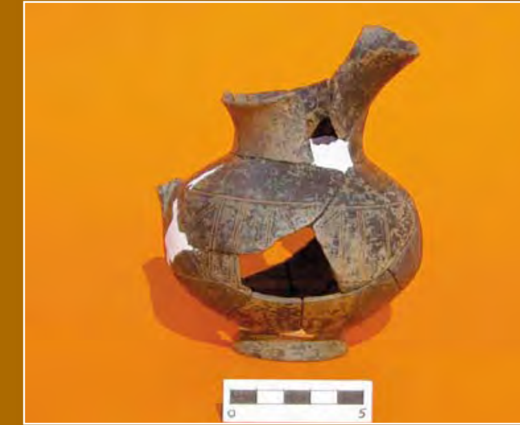
Resim-3 Kerkenes'ten Pişmiş Toprak Testi

Located in Şahmuratlı village of Sorgun District ,Yozgat ; Kerkenes Dağı ancient city surface searches were strated in 1993. During 1998-2000, it turned to be a museum participation research and from 2001 up to now excavation and research studies have been going on in the management of Dr. Geoffrey Summers. Although it was supposed that the city was founded by Medes in the Iron age,600 B.C. . In 2003 excavation season, Phrygian inscriptions were found that showed the city was reigned by frigs before it was ruined.The 7 km stone defences enclose 2,5 square km of undulating terrain composes the settlement area.