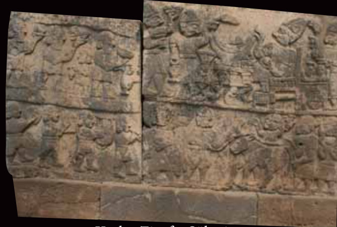
Kralın Ziyafet Şöleni