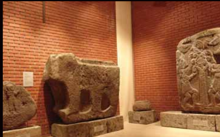
Müzenin kapalı teşhir salonu

Karatepe Geç Hitit Dönemine MÖ. 8. veya 7 yy. 'da Asurlular tarafından son verilmiştir.