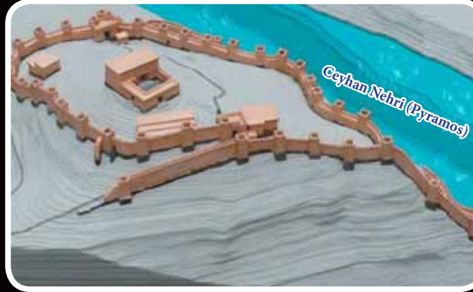
Karatepe Aslantaş Kalesi Maketi

Karatepe Aslantaş Açık Hava Müzesi, Osmaniye il merkezine 33 km. Kadirli İlçe merkezine 22 km. mesafede olup Kadirli Kızıyusuflu Köyü sınırlarında , Milli Park içindedir.