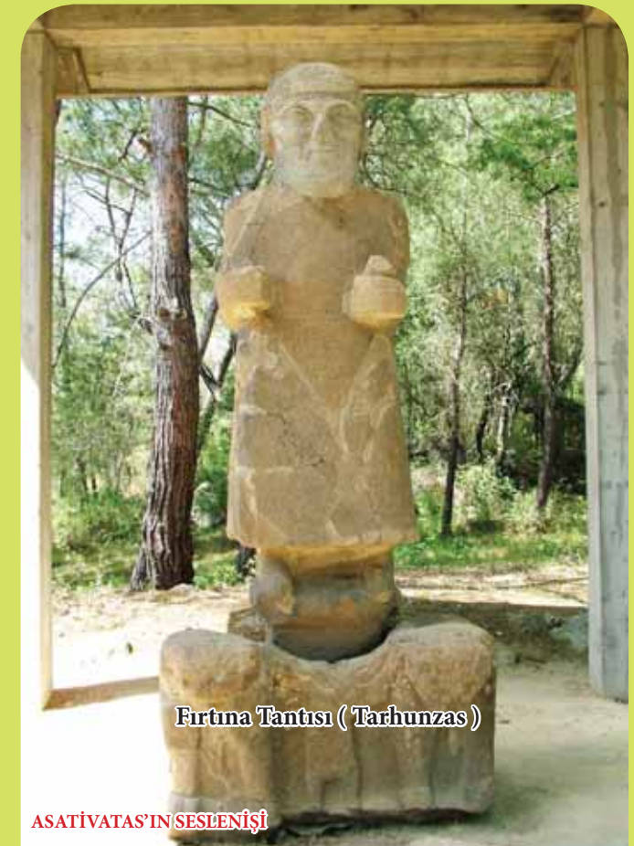
Fırtına Tanrısı ( Tarhunzas )