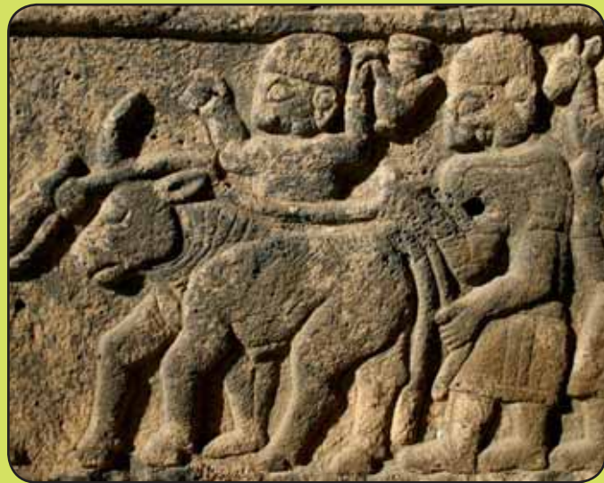
Adak Töreni Rölyefi