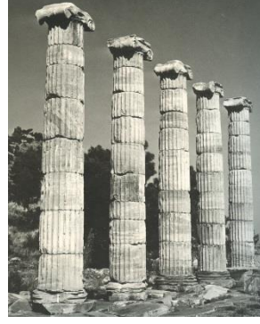
Foto.2 Priene Athena Polias Tapınağı MÖ 4.yüzyılın 3.çeyreği (E.Akurgal, Griechische und römische Kunst in der Türkei (1987) Taf.139