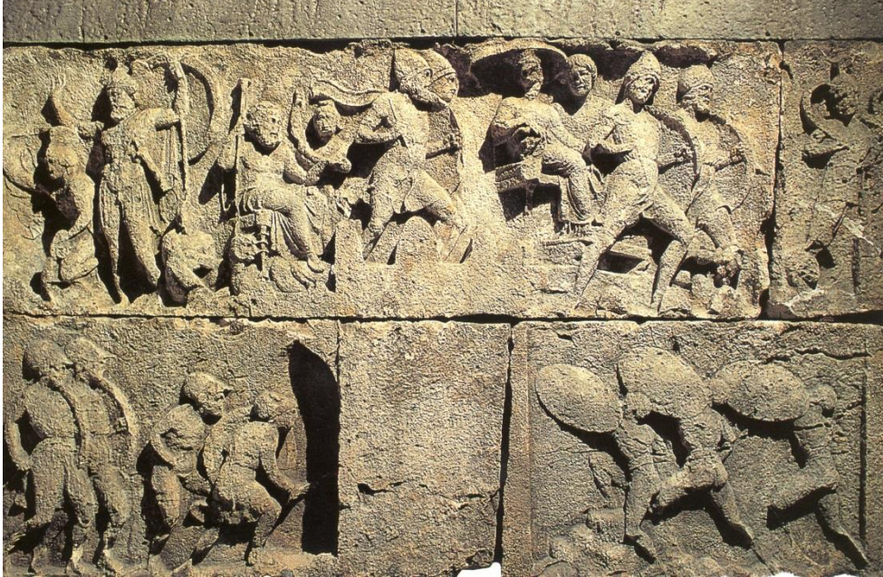
Foto.2 Trysa-Gölbaşı Heroonu batı duvarı merkezi sahne bir kentin kuşatılması MÖ 380-370 (W.Oberleitner, Das heroon von Trysa, 1994, Abb.75)