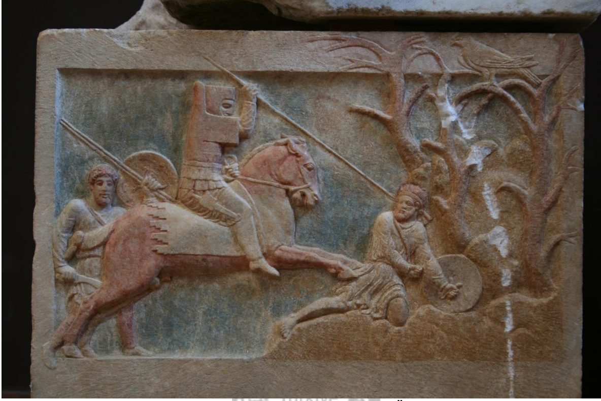
Foto.1 Çan Altıkulaç Lahdi, Çanakkale Arkeoloji Müzesi MÖ 4 yüzyıl

MÖ. 5. yüzyılın sonlarına doğru İonia alfabesinin kullanımının yaygınlaşması ile birlikte bir dil birliğinin oluşumuna doğru gidilmiştir. Ancak bölgesel alfabe kullanımı bir süre daha devam ettiği ve Yunanca dışında yerel dillerin de konuşmada ve yazıda kullanıldığı görülmektedir.