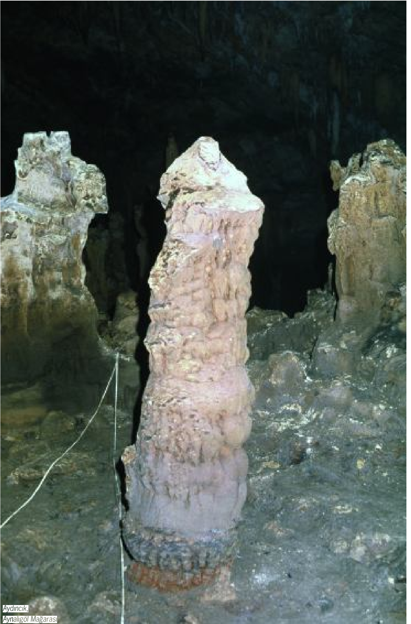
Aydincık, Aynalgöl Mağarası