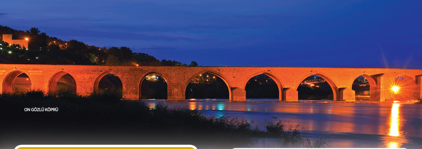
ON GÖZLÜ KÖPRÜ