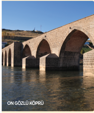
ON GÖZLÜ KÖPRÜ

Diyarbakır'ın Çüngüş ilçesinde Çüngüş Çayı üzerinde bulunan köprünün üzerinde dönemini ve yaptırınını belirten bir yazıt bulunmamaktadır. Plan ve mimari açıdan XVII. Yüzyıl'da yaptırıldığı tahmin edilmektedir. Tek gözlü ve sivri kemerli olan köprünün ana yapım malzemesi yöreden elde edilen sarı kalker taşıdır. Köprünün ayakları doğal kayalara oturtulmuştur.