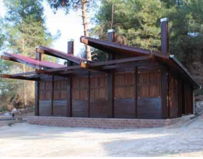
Çevre Düzenlemesi ile Yapılan Danışma Bürosu