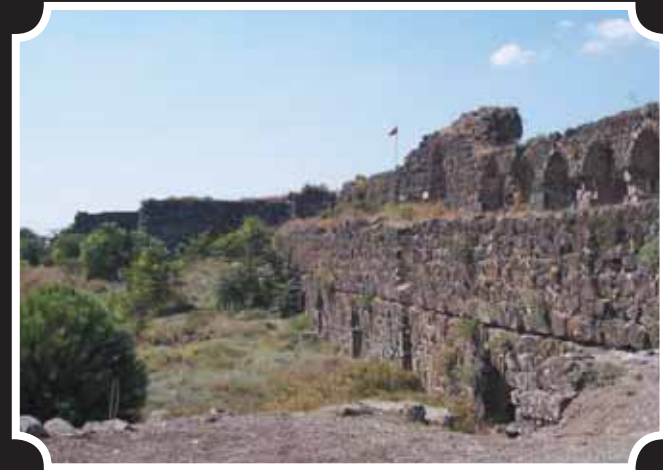
İç kale ve sur duvarları

Toprakkale Kalesi Çukurova'yı Suriye'ye bağlayan yolu ve bölgeyi kontrol altında tutmak için yapılmıştır.