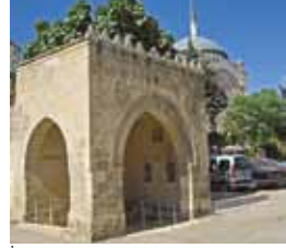
İbşir Paşa Kasteli