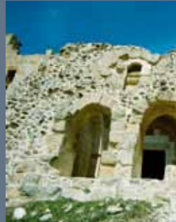
Ravanda Kalesi'nden görüntüler

The Ravanda Castle lies to the northwest of Kilis, next to Belenözü village, to the east of Afrin Brook and at 28 km distance from the city centre.