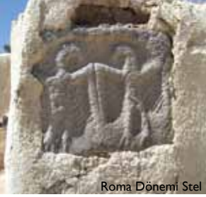
Roma Dönemi Stel