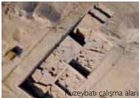
Kuzeybatı çalışma alanı