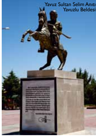
Yavuz Sultan Selim Anıtı Yavuzlu Beldesi