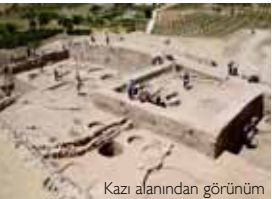
Kazı alanından görünüm

Yerleşimin çok yoğun olduğu Kilis'te 2010 yılında Oylum Höyük dışında Kurukastel Ören Yeri, Söğütlü Harabeleri, Kurtaran Köyü ve Çörten Höyüğü'nde kazılar yapılmıştır. Kazılarda M.S. 4-5. yüzyıla ait mozaiklere ulaşılmıştır.