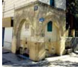
Küçük Çarşı Kasteli