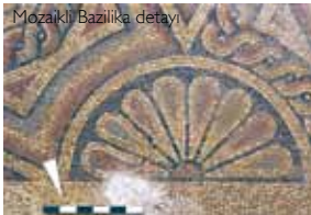
Mozaklı Bazilika detayı