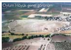
Oylum Höyük genel görünüm

In the city of Kilis, which has been home to many different settlements, excavations were carried out in 2010 in the ruins of Kurukastel; the ruins of Sögütlü; the village of Kurtaran; and the Çörten Tumulus, in addition to those in the Oylum Tumulus. During the course of these excavations, mosaics dating back to 4 th -5 th centuries AD were unearthed.