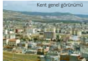
Kent genel görünümü