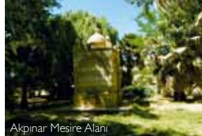
Akpınar Mesire Alanı